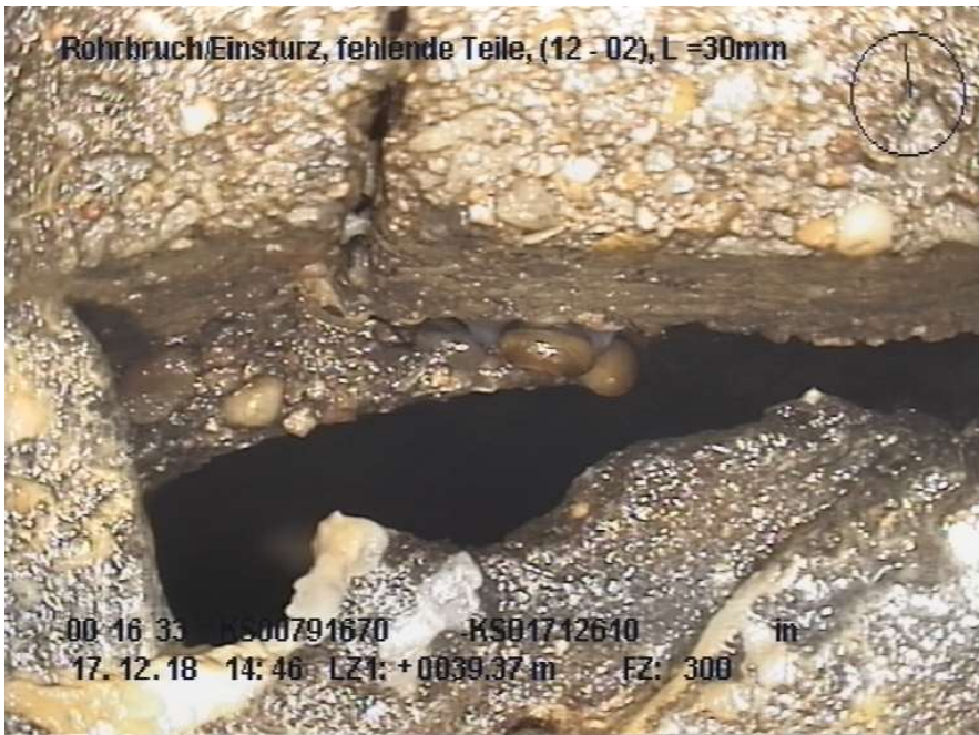
Abbildung 1: Südstraße Haltung KS 00791670 – KS 01712610, Rohrbruch/Einsturz

Nachfolgend einige Abbildungen mit Fotos aus der Kanalinspektion, die den Handlungsbedarf unterstreichen: