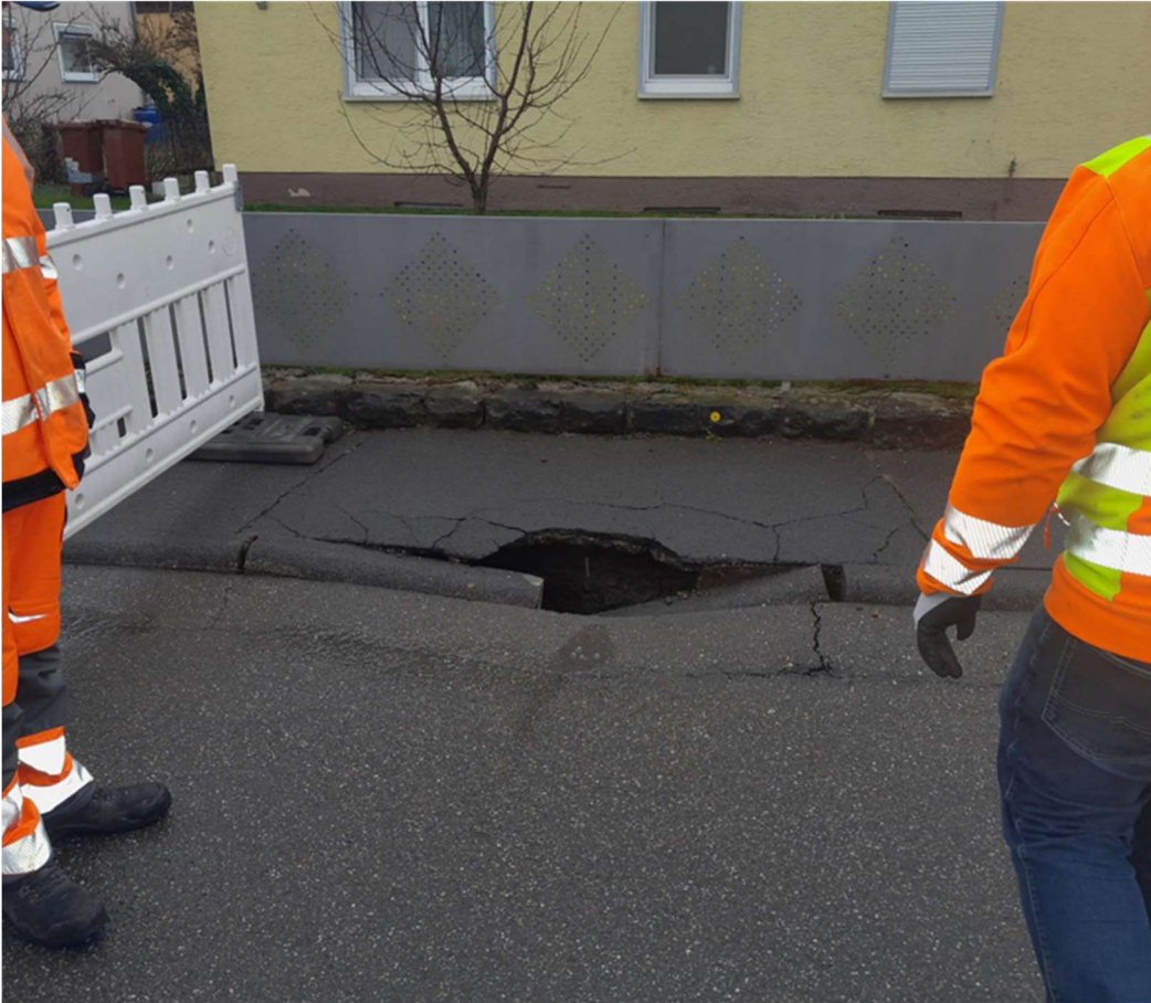
Abbildung 5: Südstraße Straßeneinbruch 20.02.2024

Dieser Vorfall erforderte sofortige Maßnahmen durch den Jahresbau.