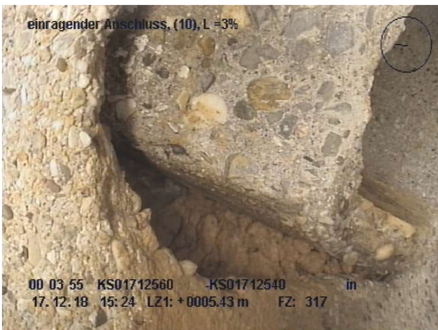
Abbildung 2: Südstraße Haltung KS 01712560 - KS 01712540, einragender Anschluss