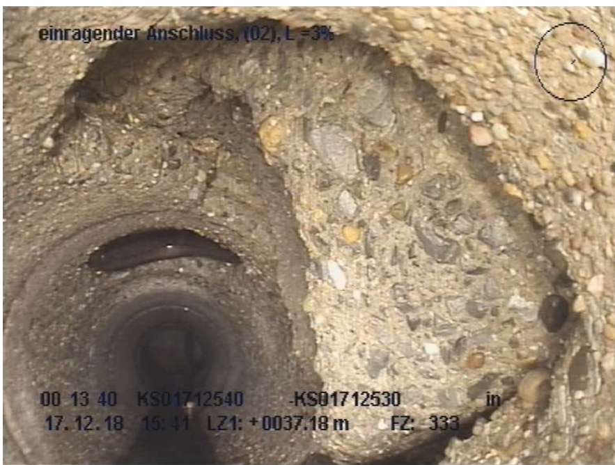
Abbildung 4: Südstraße Haltung KS 01712540 - KS 01712530, einragender Anschluss

Anfang des Jahres 2024 kam es nun zudem im Bereich der Südstraße zu einem Wasserrohrbruch, welcher zu weiteren Ausspülungen um den Kanal geführt und somit die Situation verschärft hat.