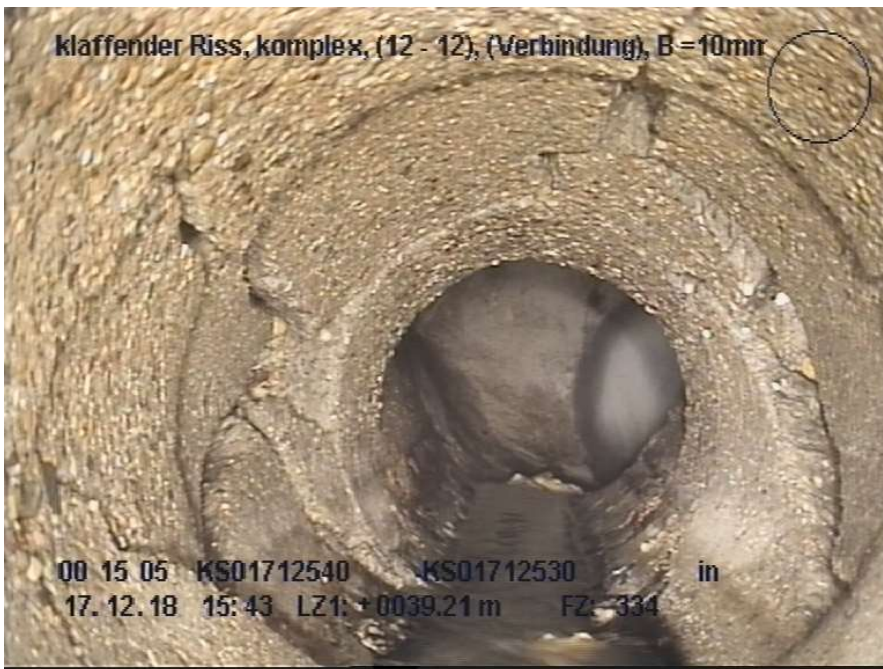
Abbildung 3: Südstraße Haltung KS 01712540 - KS 01712530, klaffender Riss